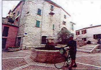
La place de la Fontaine qui berce Bouyon.