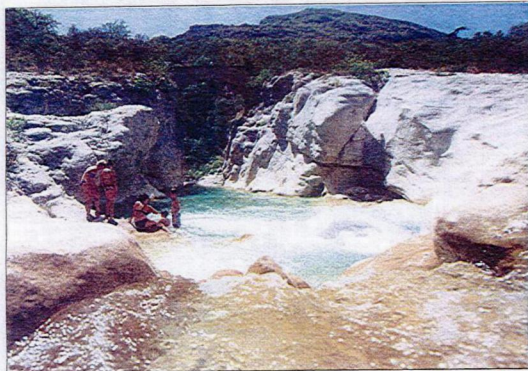
Quelques heures de rando pour ce petit coin de paradis.

Son clocher est visible de loin. L'Église Saint-Trophime