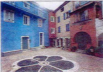
La place du Four auréolée de couleurs.